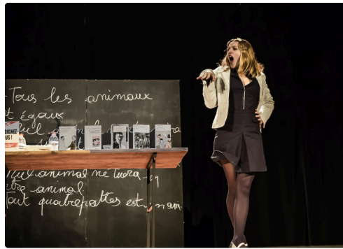
8 Suite 1bis 091016.jpg