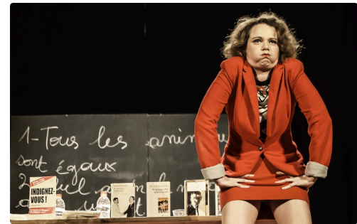
9 Suite 1bis 091016.jpg