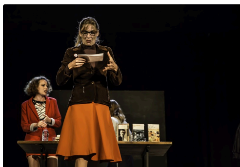
4 Suite 1bis 091016.jpg