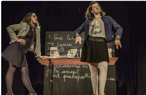
10 Suite 1bis 091016.jpg