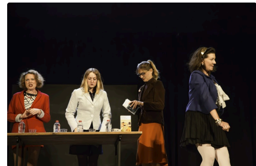
3 Suite 1bis 091016.jpg