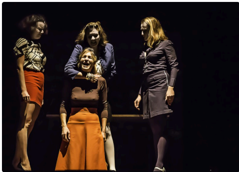
13 Suite 1bis 091016.jpg