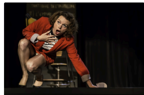
6 Suite 1bis 091016.jpg