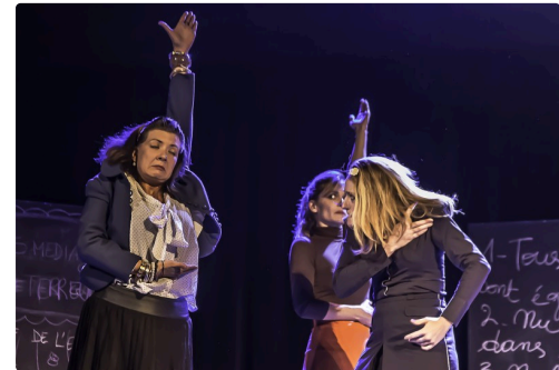
12 Suite 1bis 091016.jpg