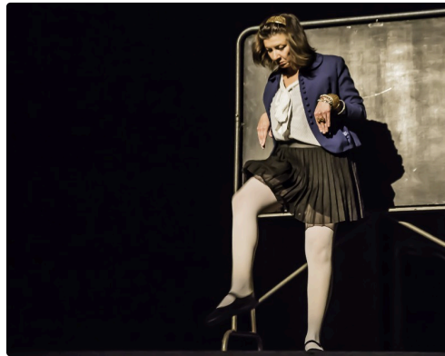
11 Suite 1bis 091016.jpg