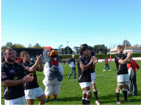
les joueurs remercient les supporters.