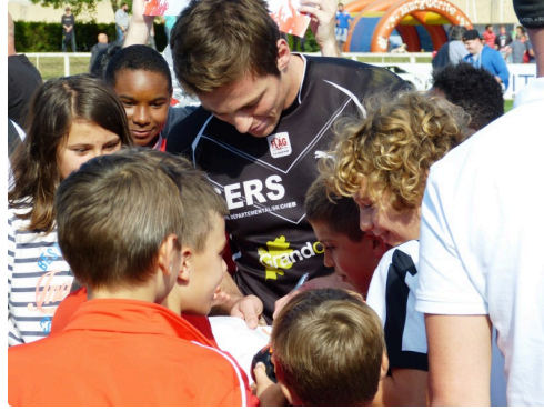
C'est l'heure des autographes.