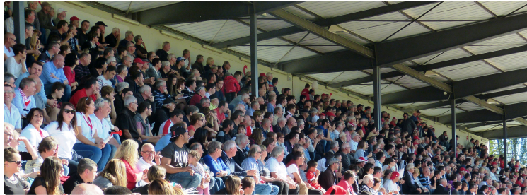
FCAG 33 TARBES 10

Quand le poulet du Gers mate l'ours des Pyrénées