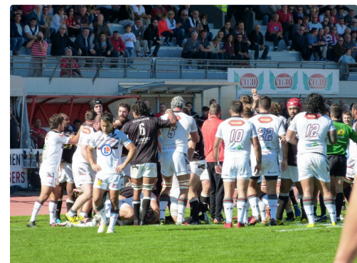
La confiture de châtaignes bigourdane entraîne un carton jaune et 3 points pour le FCAG.