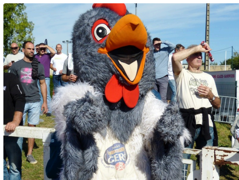
LA MASCOTTE veille au grain , hum !