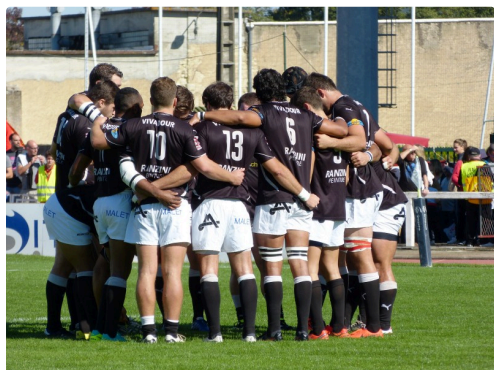
Regroupement d'avant match, dernières consignes.

Cliquez ici pour voir l'entrée des joueurs sur le terrain.