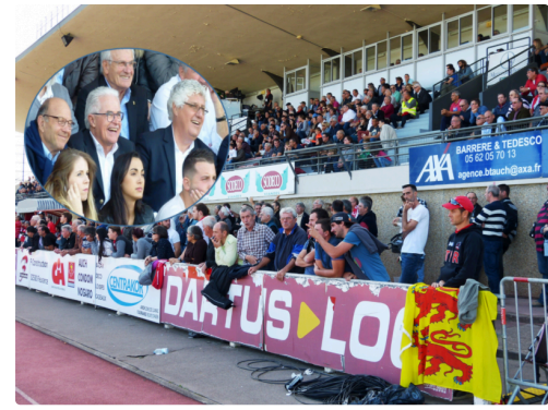
la tribune officielle bien garnie, Belle humeur chez les officiels !