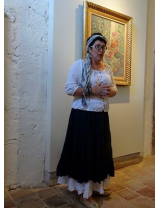
Moitié pomme ou moitié orange