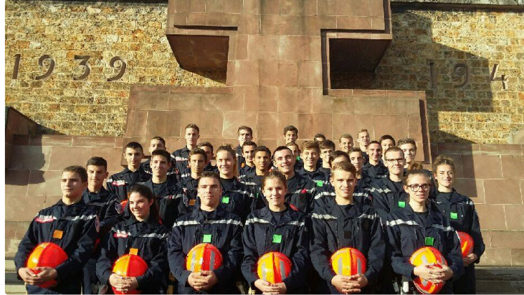
Voyage mémoriel pour des jeunes sapeurs pompiers gersois

Quatre jours au cœur de la capitale de ses institutions et de son histoire