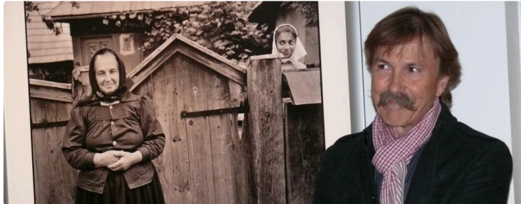
Abbaye de Flaran : Le huitième sillon s'ouvre sur le monde rural roumain

Un authentique reportage anthropologique social et culturel du photographe Jean-Jacques Moles