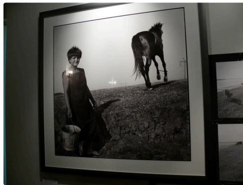
Une séduisante roumaine va pied pied nu dans les champs.