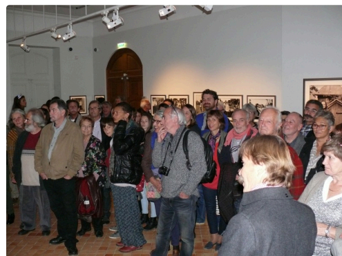
Beaucoup de monde lors du vernissage qui s'est déroulé le vendredi 21 octobre.