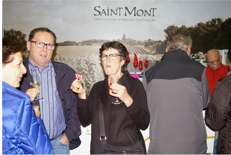
La "Colombelle primeur" était présentée jeudi soir a Plaisance

Il y avait affluence au "Caveau Plaimont" du giratoire