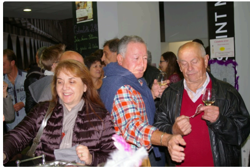
Dégustation de la Colombelle

Jeudi des 18 h 30 le millésime 2016 de la colombelle était proposé à la dégustation au caveau "Plaimont" du giratoire de Bonnet . Il n'y a pas eu de quart d'heure Gascon traditionnel tant les amateurs de bonnes choses étaient là à l'heure et même avant l'heure . Pour symboliser sa légèreté en bouche les bouteilles étaient joliment décorées d'une plume. Les vigneron, les amis et anciens du Saint-Mont, le personnel du caveau se sont multipliés pour offrir amuses bouches et le primeur aux présents tous ravis à l'évidence d'être venus. La belle animatrice Lady Tahiti accompagnait musicalement cette avant soirée qui a conduit plus qu'à la nuit tombée ce qui a permis aux derniers partants d'apprécier l'éclairage récent du giratoire en repartant