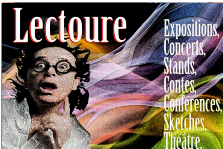
Vous avez dit bizarre, comme c'est bizarre ce festival de tous les arts

Théâtre, musique, photos, peinture, lecture faites votre choix