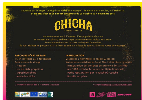
Chicha St-Clar V.jpg

Ce projet est porté par Culture Portes de Gascogne, et soutenu par la mairie de Saint-Clar, et les fonds européens Leader (demande en cours).