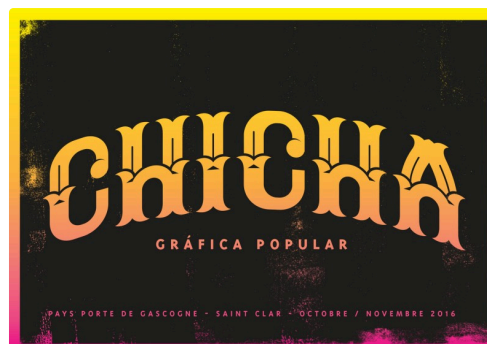
Chicha St-Clar R.jpg