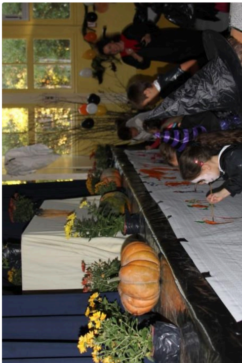
l'atelier de peinture

La soirée a fait un tabac auprès des petits et des grands, bravo à l'équipe du Foyer.