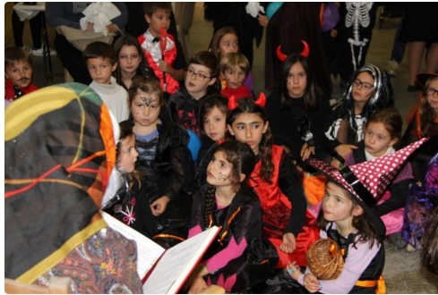
l'heure du conte