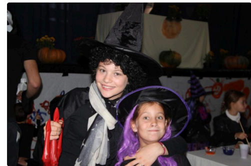
des sorcières ravies