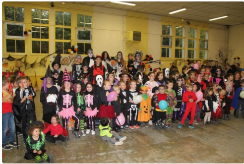
un groupe terrifiant