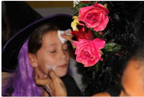
ici on maquille