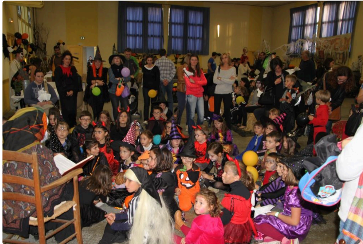
Joyeuse fête d'HALLOWEEN à Duran

Une centaine d'enfants "horriblement" déguisés