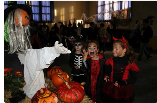
des diables hilares