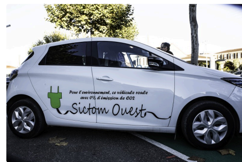
La Zoé du Sictom Ouest