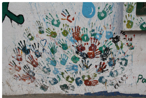
Gers Himalaya Juin 2015 798 (Copier).JPG