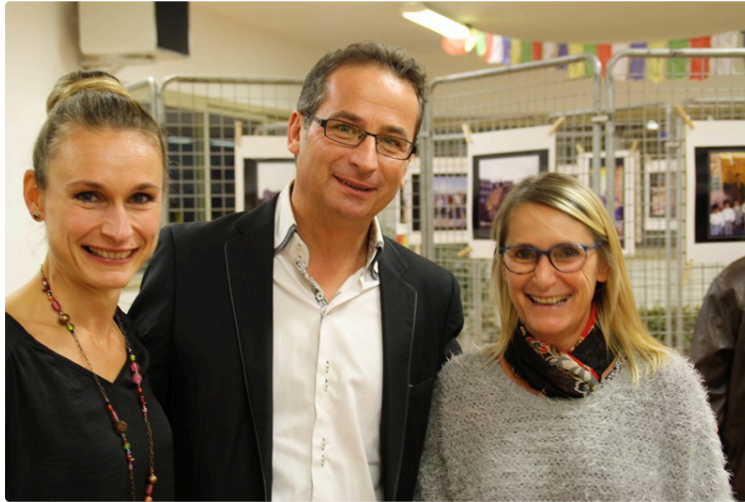
Gers Himalaya : l'association attend votre aide

Les associations Gers Himalaya et Regards croisés sur le Népal sont associées pour éditer un ouvrage de photographies de tags, peintures murales, recensées en marchant dans les rues de Katmandou, capitale du Népal. Le plus symbolique est certainement cette inscription en rouge apparue après le 25 avril 2015 : Earthquake 2015 04 15. Bien d'autres sont des messages d'hygiène et propreté quotidienne. D'autres encore... Achetez cet ouvrage et vous découvrirez la suite.