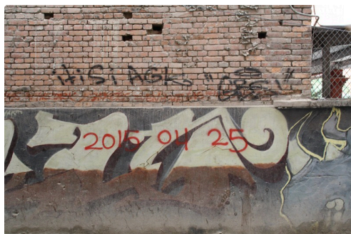
Gers Himalaya Juin 2015 438 (Copier).JPG