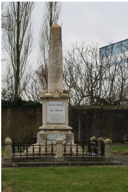
Villecomtal sur Arros.jpg