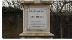
Une journée du 11 novembre bien fournie.

La municipalité organise la cérémonie au monument aux Morts à 11 heures, suivie d'un vin d'honneur.