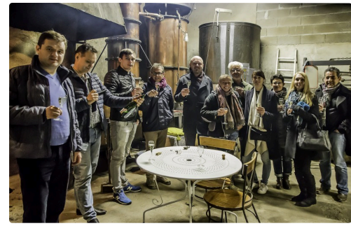
Une joyeuse ambiance...