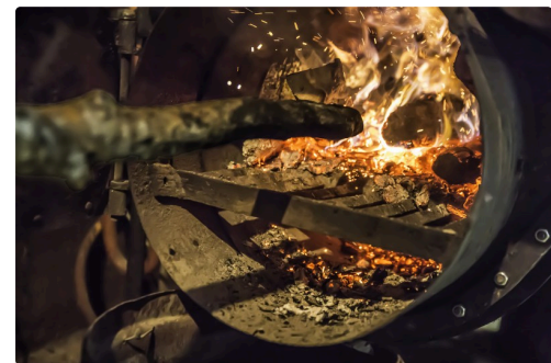
Il recharge le foyer