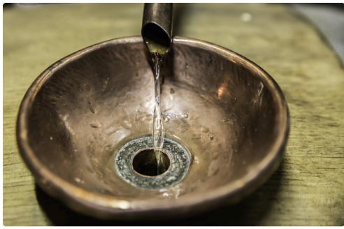
La blanche d'armagnac arrive et parfume l'atmosphère