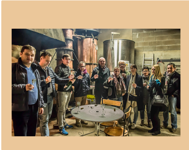
Cravencères – Le domaine du Loc reçoit des clients russes

Guidés par Marussia Beverages et Millésimes & Traditions