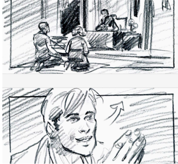
Cinéma l'Europe a Plaisance