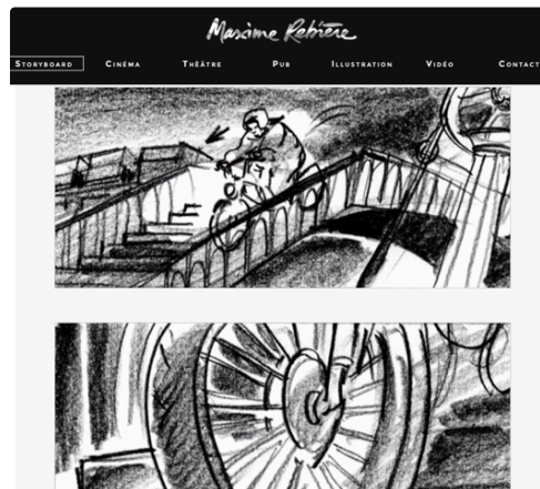
Screen Shot Micmac Jeunet.png