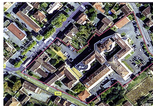
Vue aérienne de l'hôpital entouré de violet (document de l'hôpital)