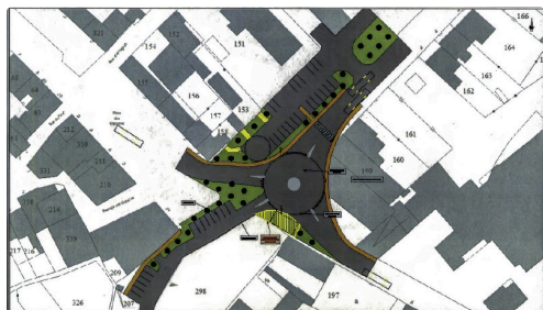
Projet communal du carrefour avenue des Pyrénées-avenue du Général-Leclerc (l'hôpital actuel est à droite en gris) - document de l'hôpital