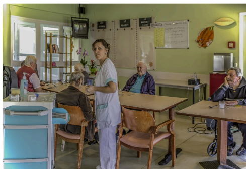
Salle à manger de la maison de retraite