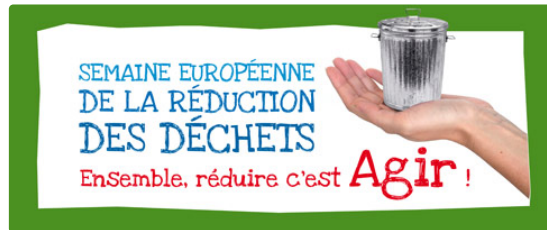
AUCH: semaine européenne de la récupération des déchets

pédagogie, pédagogie et encore pédagogie.