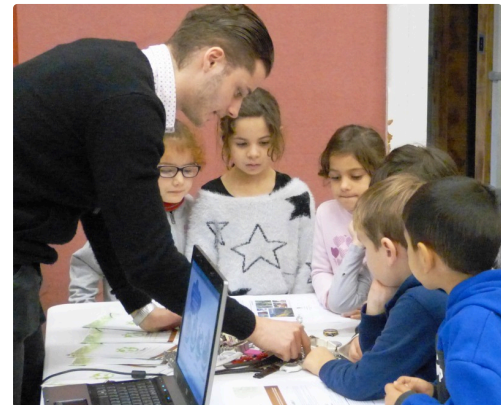
Au stand " Le comptoir solidaire"