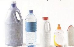
Bouteilles et flacons en plastique.

Vous déposiez dans votre sac/bac de tri tous les emballages métalliques, les emballages en carton, les bouteilles et flacons en plastique.