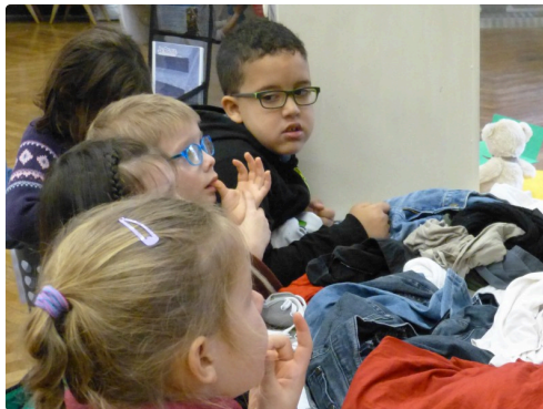
les enfants s'informent auprès du stand " Relais" récupération des vêtements