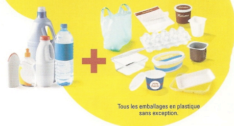
Tous les emballages en plastique sans exception.

Vous continuez à déposer dans votre bac de tri tous les emballages métalliques, les emballages en carton, les papiers et, en plus de cela, tous vos emballages en plastique sans exception.