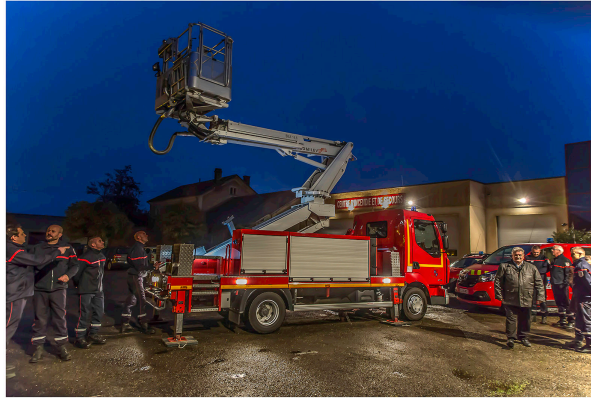
Nogaro – Les sapeurs-pompiers reçoivent un bras élévateur

Les sapeurs-pompiers du Centre principal de secours (CPS) de Nogaro, commandés par le lieutenant Pascal Barbier, ont reçu depuis quelques jours plusieurs véhicules, dont un camion équipé d'un bras élévateur articulé qui peut monter jusqu'à 19,50 mètres. Tous les conducteurs de poids lourds du Centre ont déjà été formés à l'utilisation de ce bras élévateur.