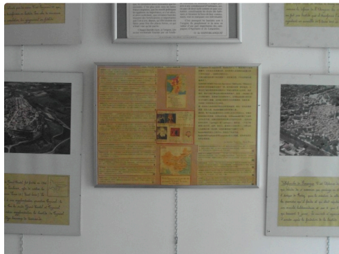
Les textes sur les Bastides sont traduits en chinois.