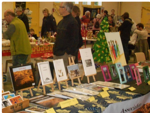
Au choix, tableaux, décorations de Noël, ouvrages de fêtes, réalisations manuelles par les enfants ....

Un avant goût de Noël qui a enchanté les petits et réjoui les grands