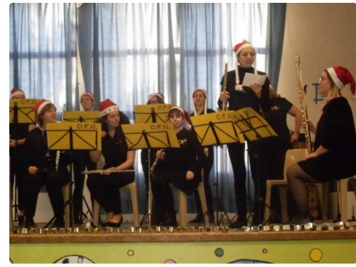
Chut, silence svp, le concert va commencer.