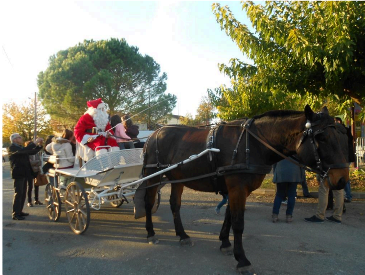
C'est la saison des marchés de Noël

L 'APE de Duran a joliment contribué au lancement