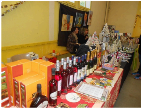
Vins, apéros et plein d'autres choses encore