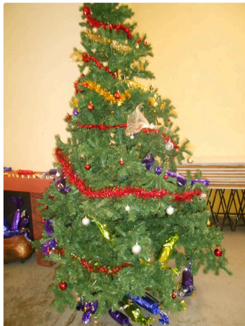
Un grand et beau sapin...