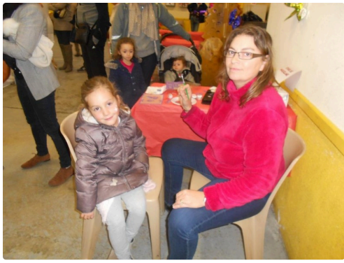
Maquillage de fête pour les filles et les garçons