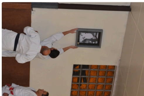
Pose de la photo.

A noter que le 11 décembre le club organisera sa traditionnelle coupe de la ville.