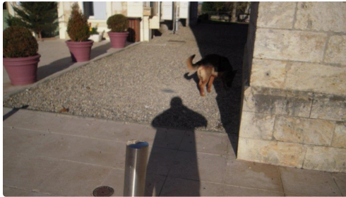
Le chien loup qui a déposé trois belles crottes sur la gauche !