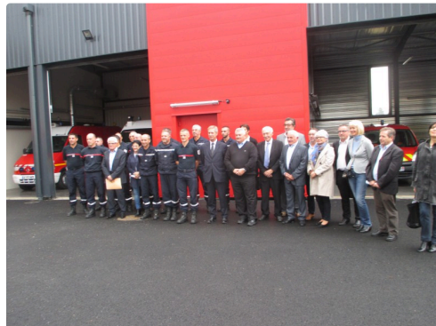
Rassemblement du C.A. du S.D.I.S devant la nouvelle caserne