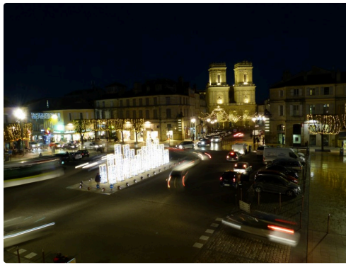
Place de la libération