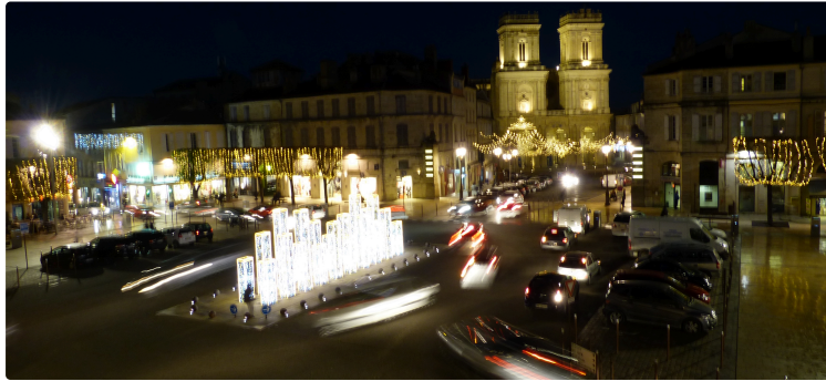
Auch : Noël, c'est parti !

10 jours de manifestations, d'animations, de réjouissances.