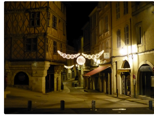
La rue Dessoles.