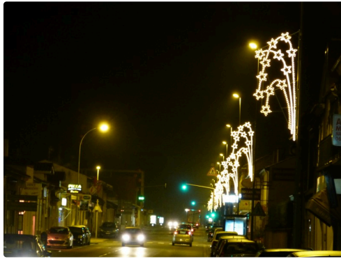
Avenue des Pyrénées