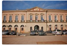
L'Isle-Jourdain : conseil municipal

Le conseil municipal aura lieu le jeudi 8 décembre à salle de la Mairie à 20h30