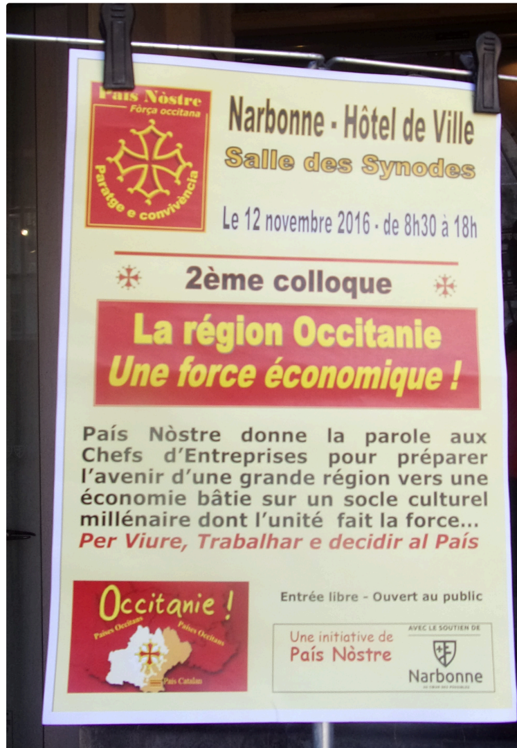
L'Occitanie, une force économique

"Bastir Occitanie" intervient au colloque