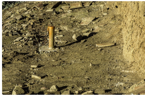
Sonde dans le talus du mur de terre