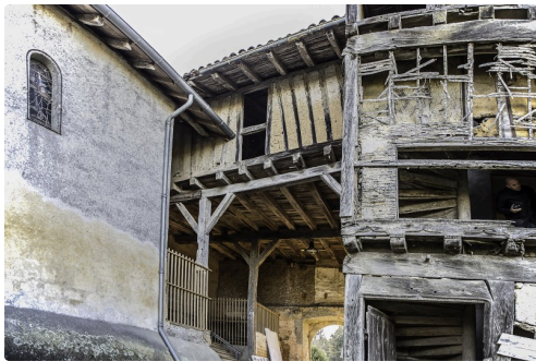
Le castet avec l'entrée de l'église