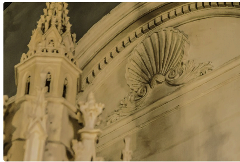
Coquille saint-Jacques derrière le maître autel