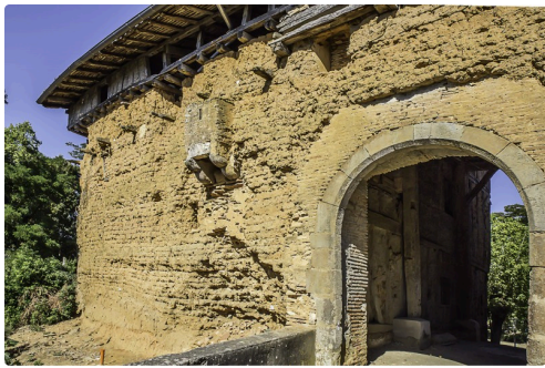
Le Castet et son mur de terre exceptionnel