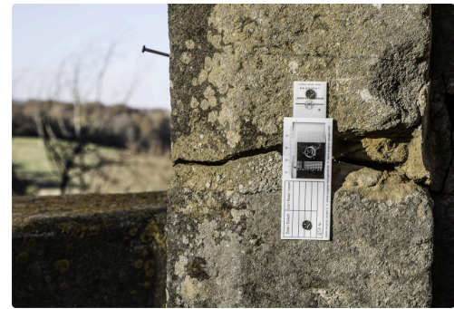
Témoïn sur le porche du rempart