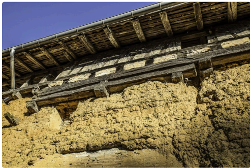
Des restes de pont-levis sont visibles