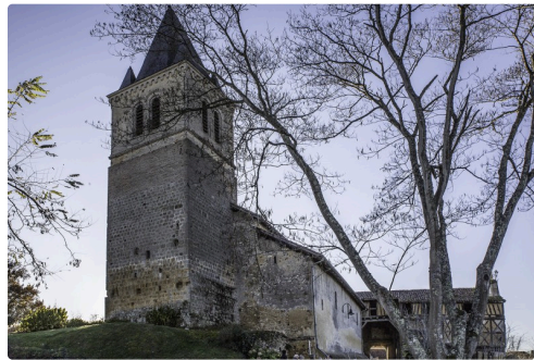
Le clocher est un ancien donjon remanié plusieurs fois