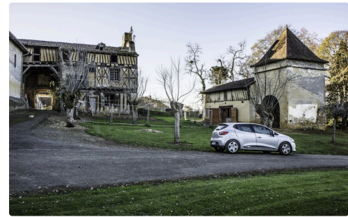
Le castet côté est avec l'autre bâtiment