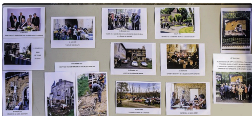
Panneau illustrant l'histoire des événements relatifs au Castet