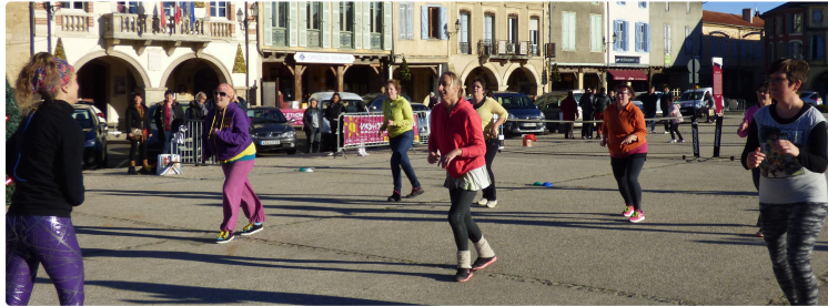
Marciac : le Téléthon a mobilisé toutes les associations