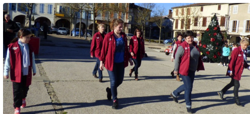
les danseuses de country