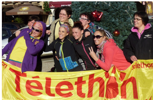
les danseuses de zumba