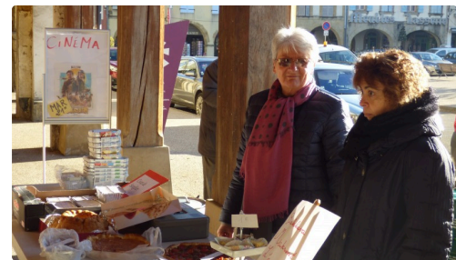
le stand de CLAP