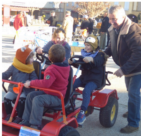
les jeunes sur un vélo original