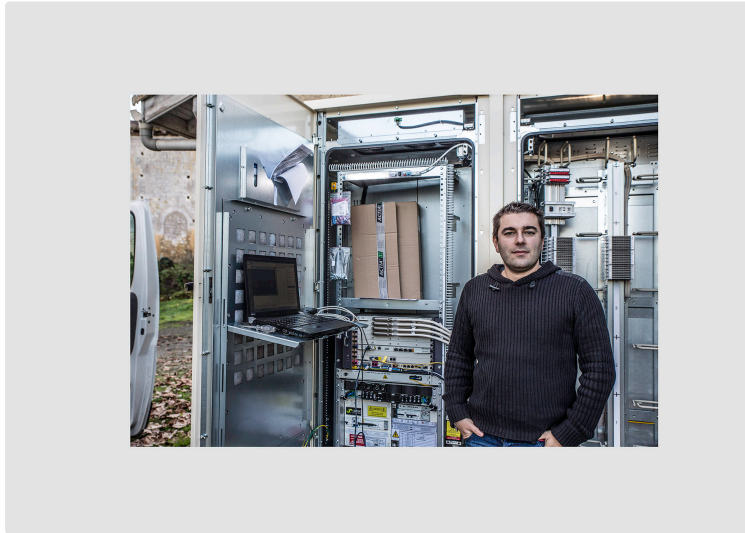
Bouzon-Gellenave – Les travaux du très haut débit se terminent

L'après-midi de ce mardi 6 novembre, la route Nogaro – Aignan entre Nogaro et le carrefour avec la route Urgosse- Sion est barrée par les gendarmes. Non, il ne s'agit pas d'une reconstitution judiciaire ou d'une chasse à l'homme ! Le très haut débit qui arrive jusqu'au sous-répartiteur sis à côté de l'église de Bouzon en est la cause.