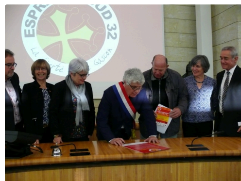
Le président du Conseil Départemental lors de la lecture de la charte.

Entrée gratuite. La carte d'adhérent à « Esprit du Sud 32 » sera disponible au prix de 10 euros.