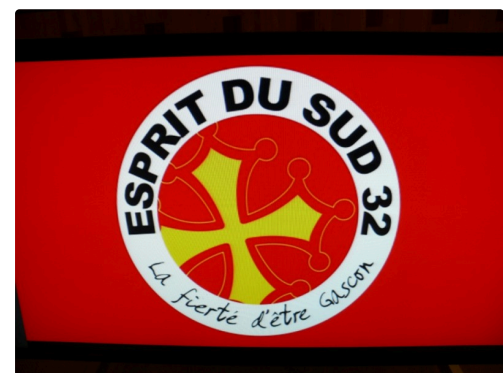
le logo de "Esprit du Sud 32".