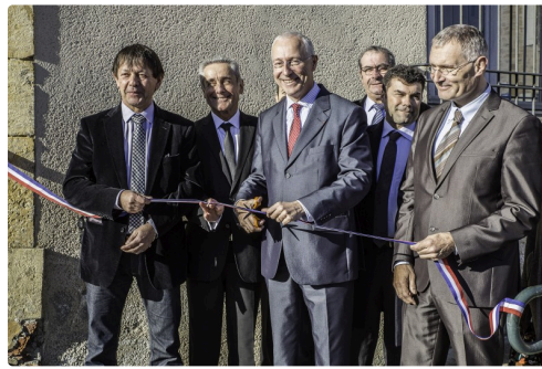
Le préfet coupe le ruban