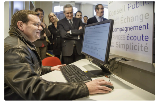
Démonstration sur ordinateur