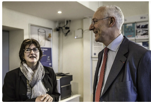
Dans la Poste devenue Maison des services au public