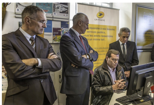
Explication du fonctionnement