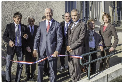
Les autorités s'apprêtent à couper le ruban