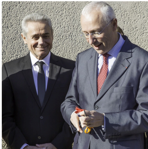
Le préfet coupe le ruban en morceaux qu'il donne aux officiels