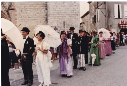
L'imposant cortège initié par la FNACA.