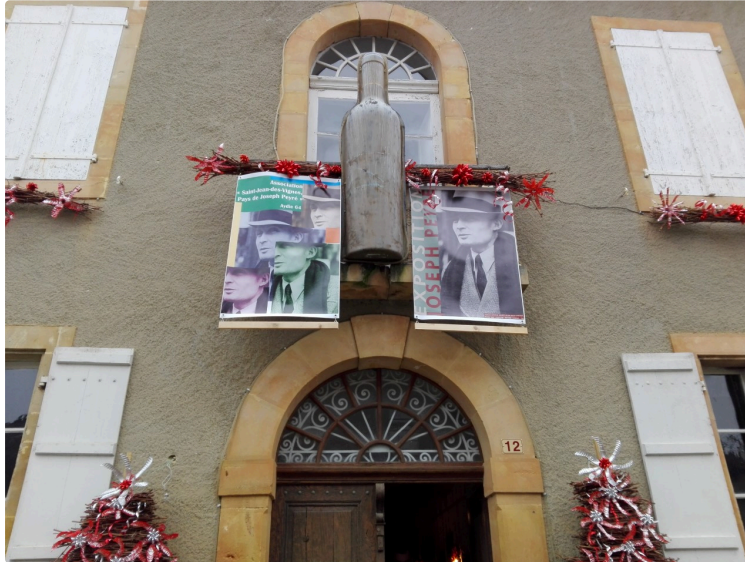
Exposition Joseph Peyré aujourd'hui à Viella

Une exposition sur l'oeuvre considérable de l'auteur de "Sang et lumières"