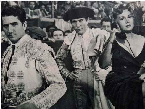
Photo du film "Sang et lumière" adapté du roman de J. Peyré, avec Daniel Gélin et Zsa-Zsa Gabor