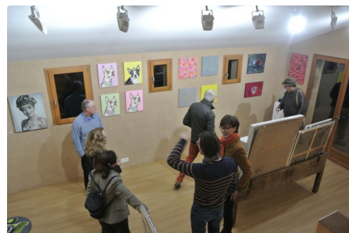
galerie garnier noilhan 4.JPG