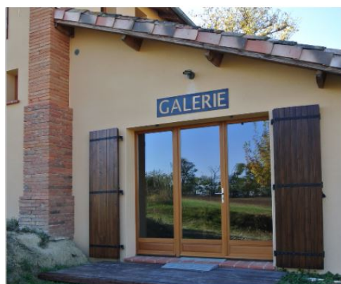
galerie garnier noilhan 1.JPG