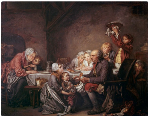
LE GÂTEAU DES ROIS. 1774 Jean-Baptiste GREUZE (1725 - 1805)