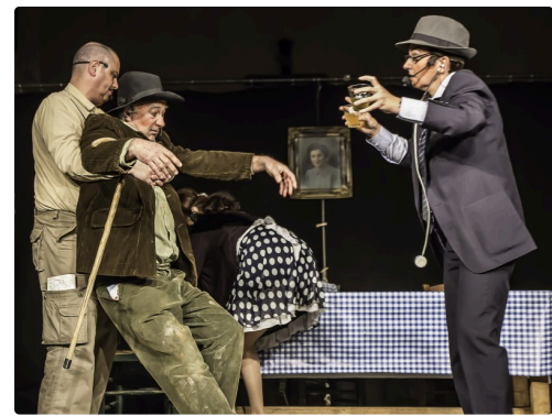
Auguste a un malaise quand il apprend que son fils dirige l'exploration pétrolière