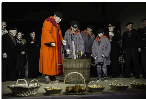
Les bouteilles de Pacherenc sont sorties