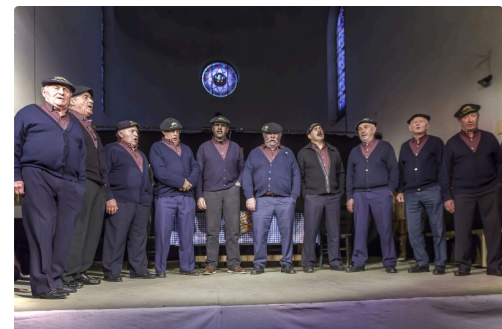
Les chanteurs vigneronns du Pachereuc du Vic Bilh