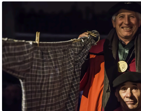
... au milieu du public