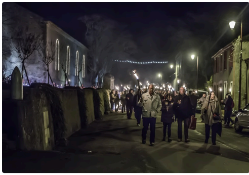
...pour les dernières vendanges