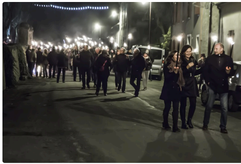
Dans la foule