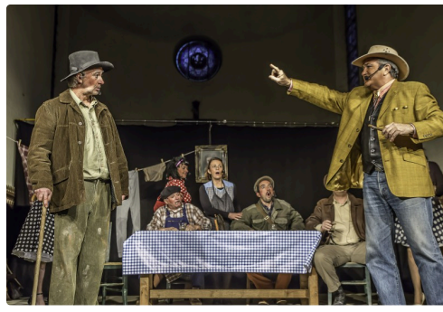
Poursuite de l'explication