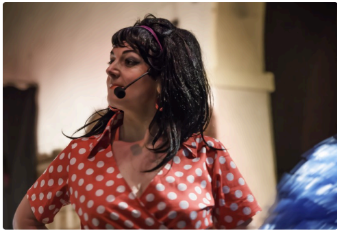
Une des girls