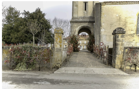
L'entrée de l'église