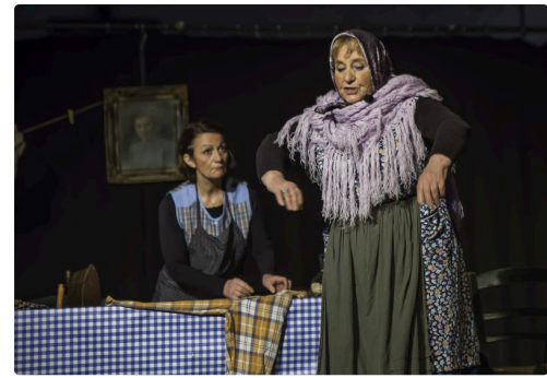
Les deux commères décrivent Auguste