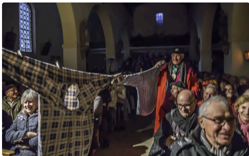
Le linge sèche...