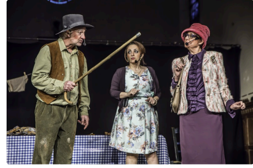
Il chasse la maire qui accepte l'exploitation pétrolière