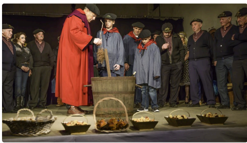
Après la représentation, on prépare la bénédiction du fruit de la vigne