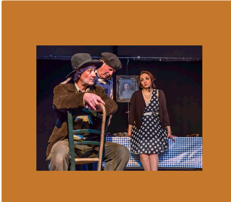
Viella – Un album de la Pastorale de la saint-Sylvestre

Les efforts des Amis du Pacherenc de la Saint-Sylvestre, ce 31 décembre 2016, réussissent à rassembler une foule nombreuse pendant toute la journée. À perte de vue, dans et à l'extérieur du village de Viella, les files de voitures se garent là où elles peuvent. La rue principale, la salle des fêtes, plusieurs maisons et l'église sont décorées depuis plusieurs semaines.