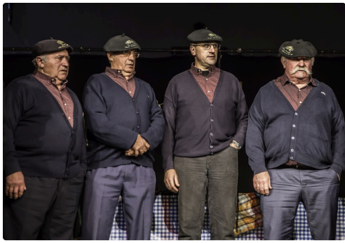
Au milieu des chanteurs