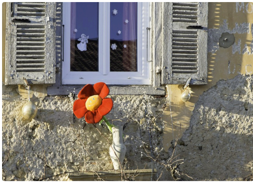
Dans la rue