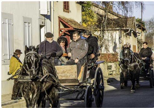
...et en calèche