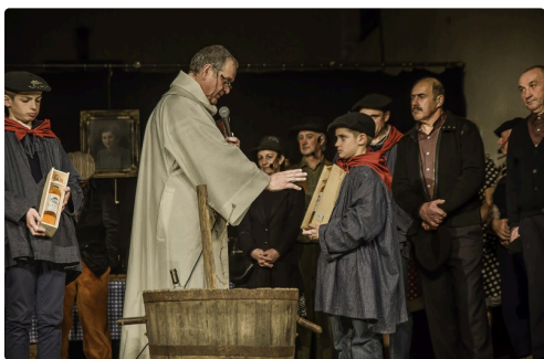
...puis à droite