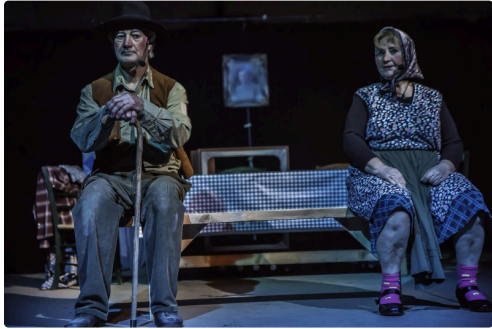
Auguste et Savina dialoguent