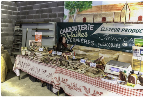
Marché de producteurs locaux : charcuterie