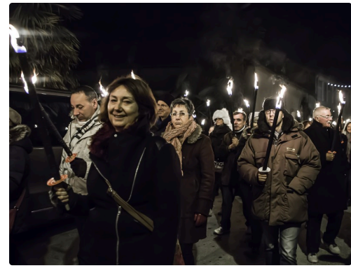
Dans la foule