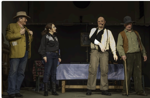
Réconciliation générale après l'accident du fils d'Auguste