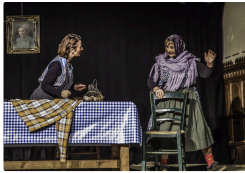
Début de la pièce