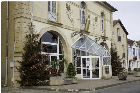
La salle des fêtes est décorée

(1) Auguste est un paysan rétif à la modernité (eau courante, électricité, radio, télévision, tracteurs etc.). Son fils revient des Etats-Unis au pays pour exploiter le pétrole dans le sous-sol. Jacques, le frère d'Auguste, revient du Texas avec des girls. Auguste fait une campagne (qu'il perd) contre la maire. Puis son fils est blessé dans un accident. Tout le monde se réconcilie et Auguste admet la modernité.