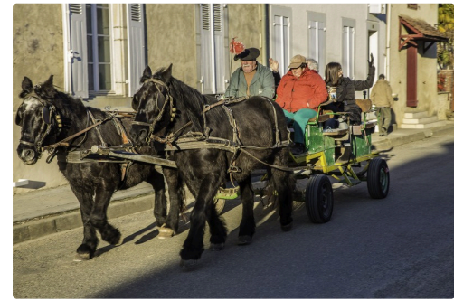
Promenade en carriole...