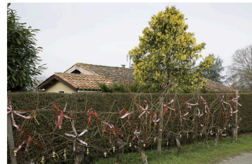
Dans la rue