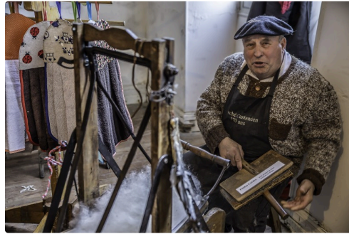
Le cardeur de laine