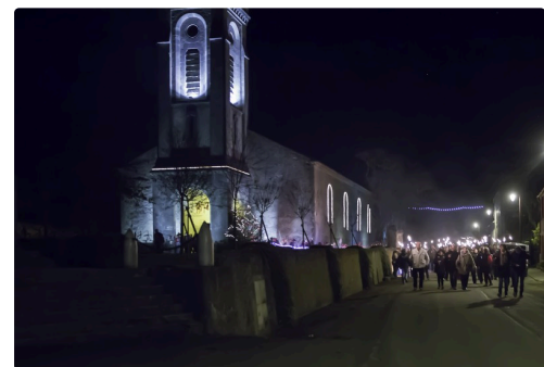
La foule se met en mouvement...