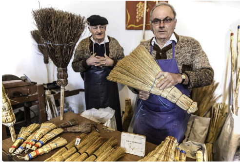
Le fabricant de balais en sorgho