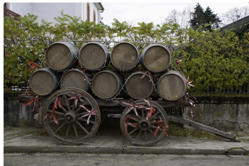
En face de la salle des fêtes