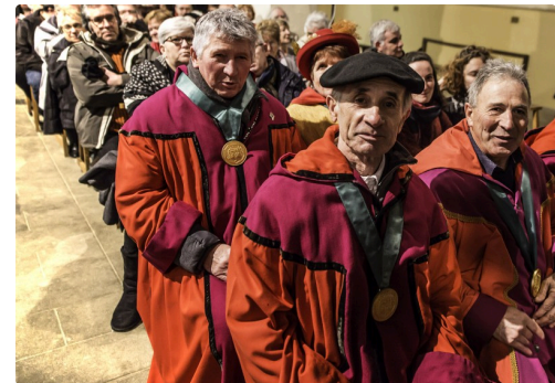
Des membres de la confrérie du Pachereuc