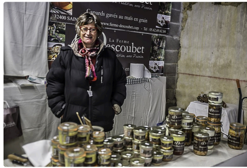
Produits du canard