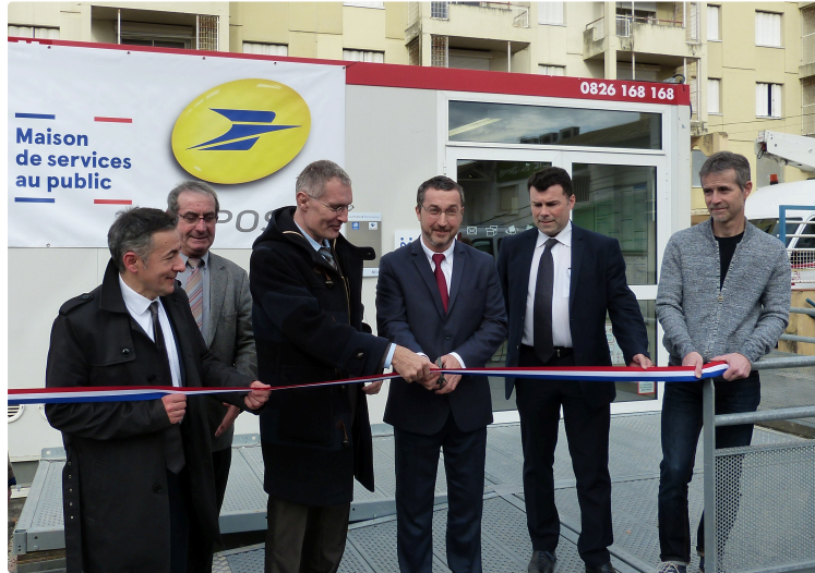
AUCH GRAND GARROS : Maison de Services au Public (MSAP).