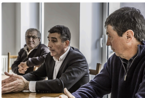
Conversation avec le maire, entouré de 2 conseillers municipaux