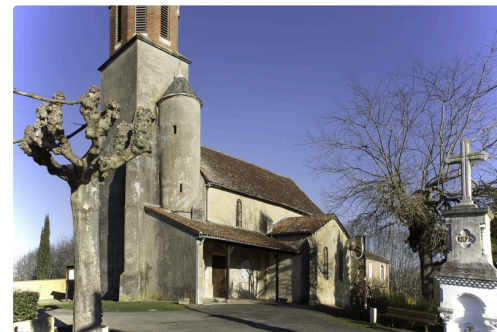
La place de l'église