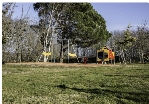
L'espace de détente