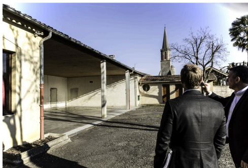
Passage par le préau de l'ancienne école et l'église