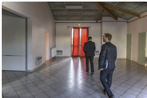
Visite de locaux communaux