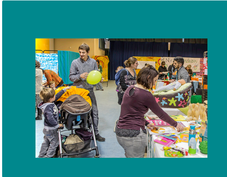
Nogaro – L'écologie relationnelle entre les membres de la famille