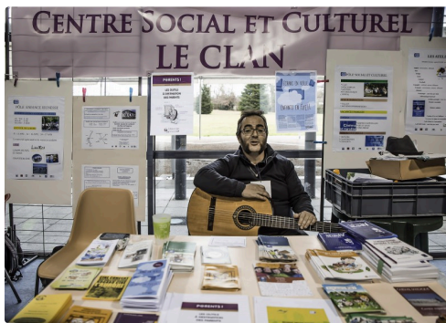
Stand du Clan centre socioculturel