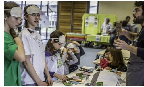
Le stand de l'Ecocentre pierre et terre de Risclé attire les jeunes