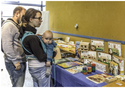
Des jeux pour quand il sera grand

Forum sur la sexualité pendant la grossesse - Document présenté par Delphine Durfort