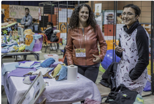
Des douceurs pour les bébé s