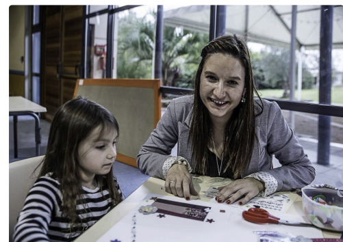
Où l'on apprend à décorer le pourtour des photos