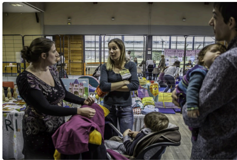
Des parents discutent avec une des intervenantes