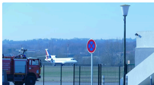
L'avion sur le tarmac.