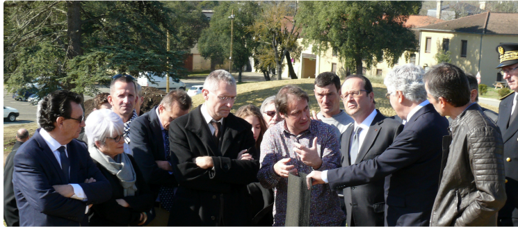
François Hollande a visité la ferme agroforestière du Conseil Départemental "parce qu'il y a ici des innovations qui sont pour l'agriculture des sources de progrès "

Puis il annonça que le ministre de l'Agriculture révélera mardi dans les Landes de nouvelles mesures concernant l'indemnisation des agriculteurs victimes de la grippe aviaire