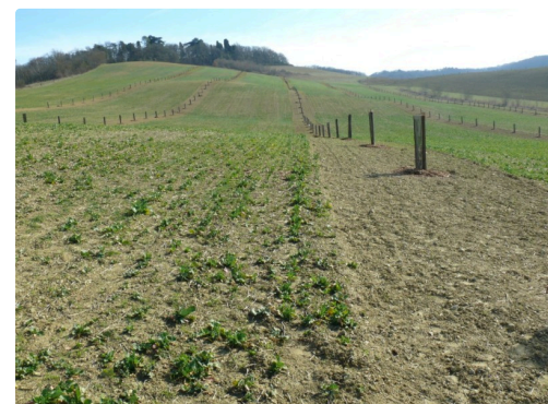
La parcelle plantée d'arbres et de son couvert végétal.