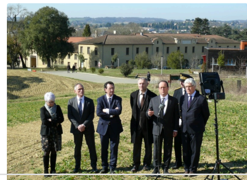
Le président François Hollande lors de son discours.