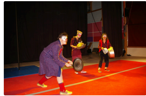
Le trio de clown