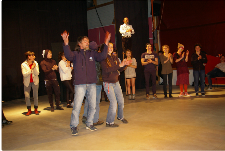
Superbe soirée " Crash-Test-Tapas " à Circ'Adour

C'était samedi soir dans la salle de cirque