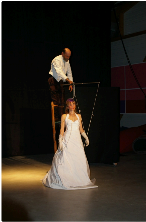
Un final élégant