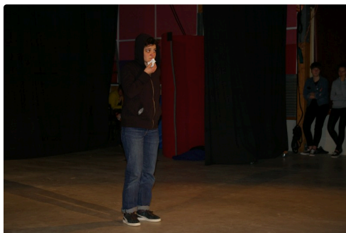
Un clown triste