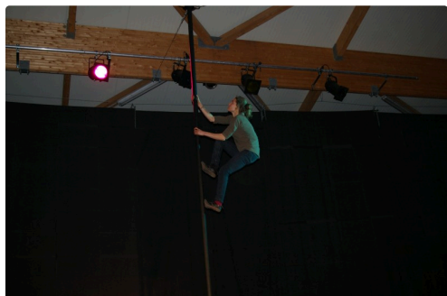
Pas besoin d'escalier pour monter