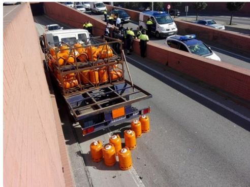
camion espagnol 2.jpg

La police urbaine de Barcelone a intercepté ce mardi matin un camion qui empruntait une voie à contre sens en périphérie de la ville. Les policiers ont du faire usage de leurs armes pour stopper la course du véhicule en tirant sur le parebrise. Le chauffeur, un suédois de 33 ans n'est apparemment pas connu de leurs services. Le camion qui transportait des bouteilles de gaz s'est avéré être un véhicule volé. Un temps la piste de l'attentat n'était pas écartée mais il s'avèrait après hospitalisation que l'homme conduisait sous l'emprise de drogues. Une enquête est ouverte compte-tenu du caractère des éléments matériels camion plus bouteilles de gaz