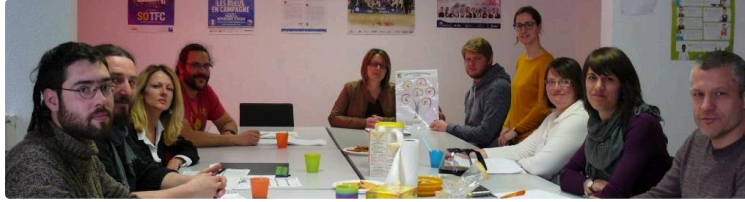
Remise du label « Eco-centre de loisirs du Gers » à neuf Centres de loisirs

Neuf centres de loisirs gersois (1) ont eu le plaisir de recevoir le label « Eco-centre de loisirs du Gers », délivré par le réseau ERE32 (Éducation Relative à l'Environnement dans le département du Gers), le mercredi 23 février dernier au Comité Départemental Olympique et Sportif du Gers d'Auch.