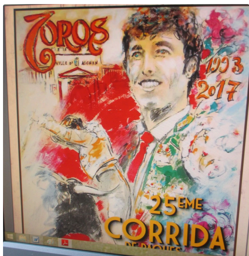
Affiche d'Yves Duffour (Lupiac)