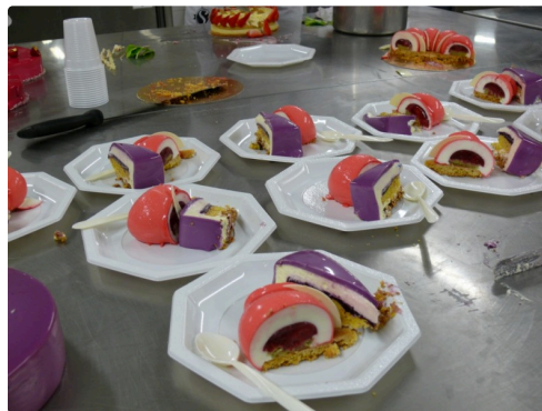
C'est le moment de déguster.