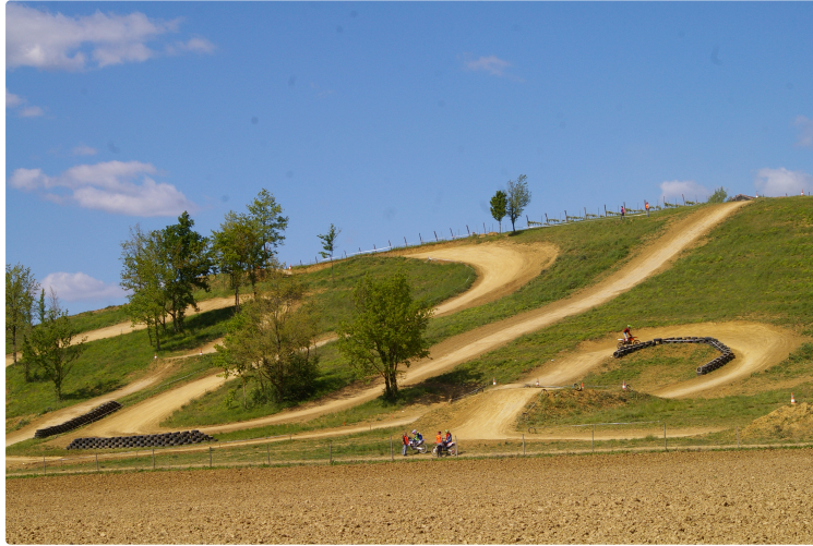
Le circuit de moto-cross de Beaumarchès "Baratte" homologué