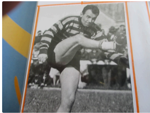
Coup de pied :3points au bout