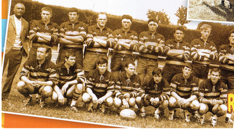
Anniversaire du titre Champion de France 1967