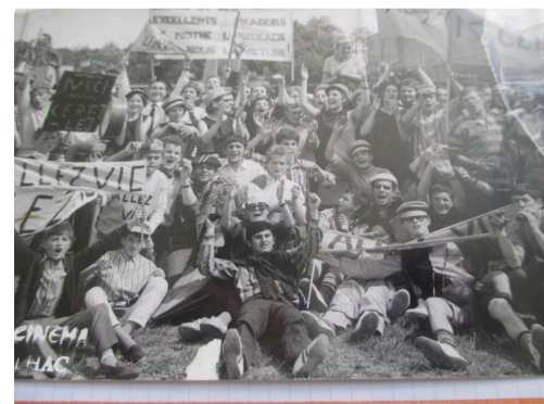
Le bonheur est sur la pelouse