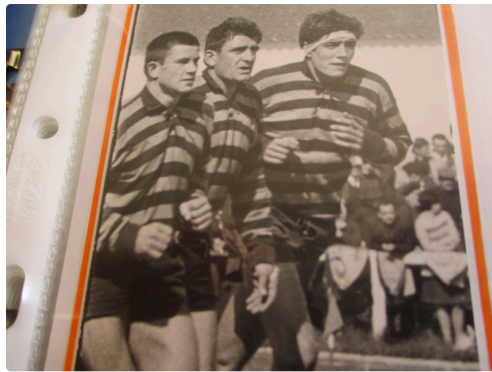
Zadro mène une fraction du pack