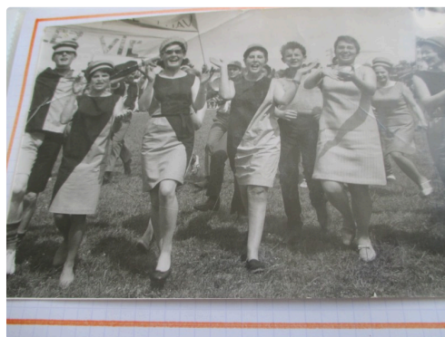
Le club des supportrices en tango et noir