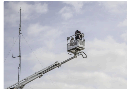
...en plein ciel