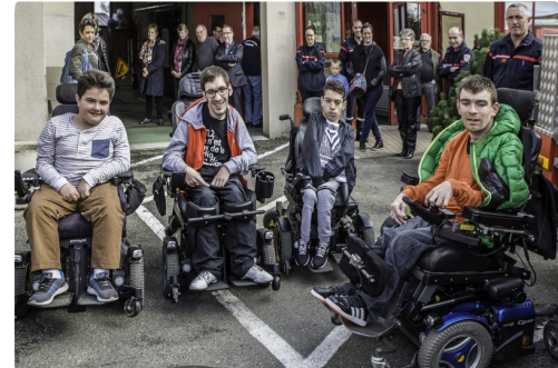
Avec ses copains