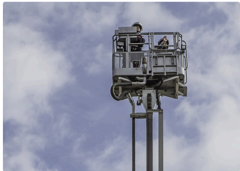
Un salut du haut du ciel