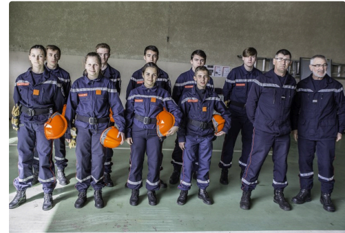
Les jeunes sapeurs-pompiers