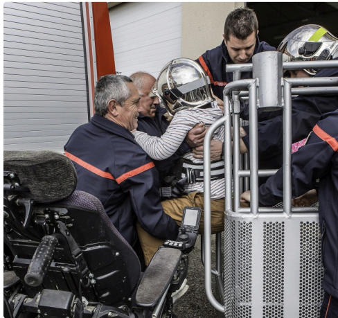
Ca y est presque