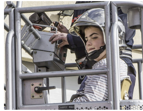
Un sourire ravi et encore un peu de rêve