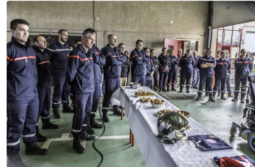
Les sapeurs-pompiers à l'écoute des interventions