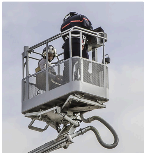
Tom regarde le sol