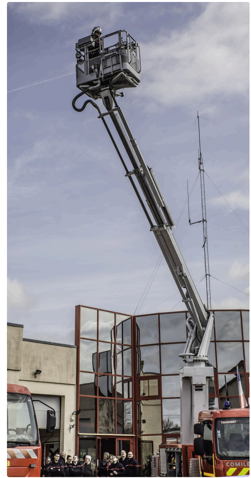
La nacelle est déjà haute