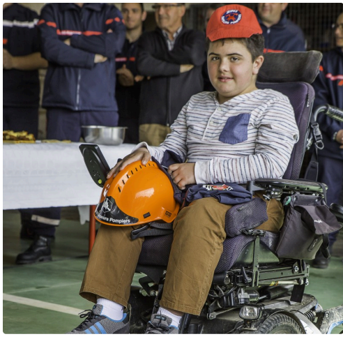
...et la casquette de jeune sapeur-pompier...