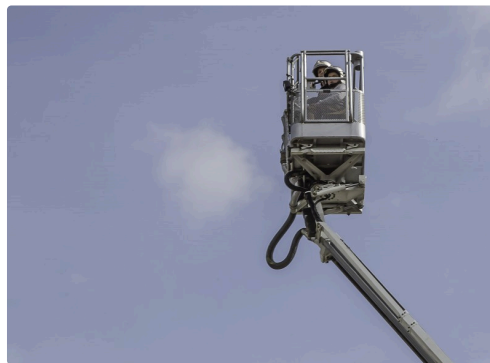
La descente est amorcée