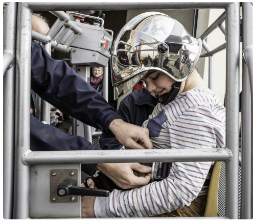
...et il faut s'équiper