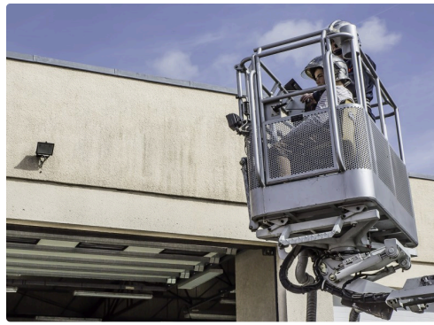
Le retour sur terre