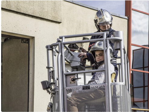
Mais oui je suis revenu !