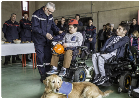
...et un autre tshirt