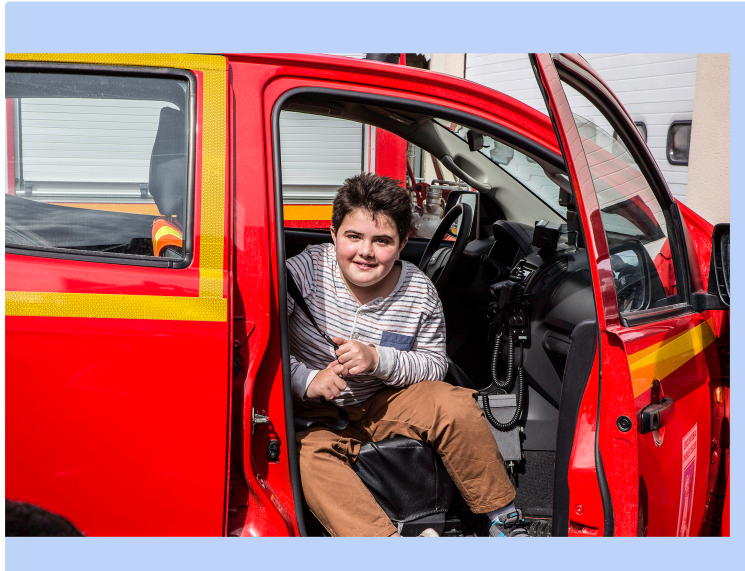
Nogaro – Immersion chez les sapeurs-pompiers