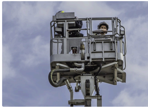
La nacelle tourne...