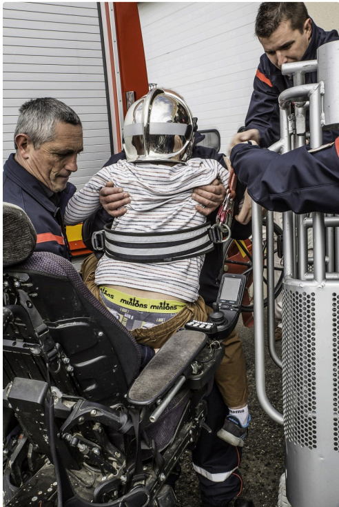
Embarquement dans la nacelle du bras élévateur articulé