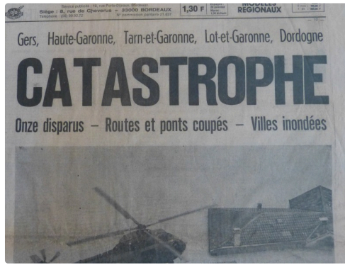
1977-2017 40 ans cette année. Exposition au premier étage du Mouzon.