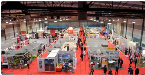
une vue du salon