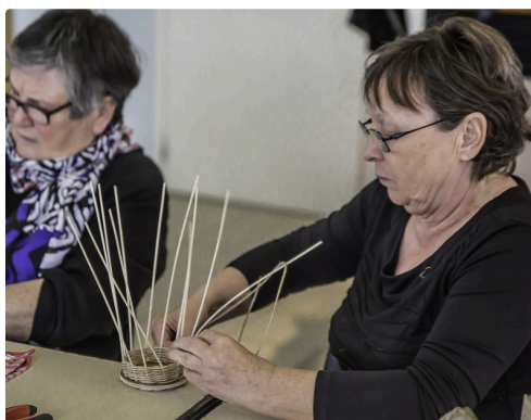
Le travail avance...