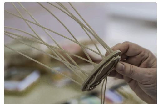
Avant cela les brins verticaux sont tressés sous le support