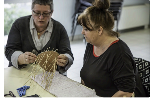
Même avec un cœur