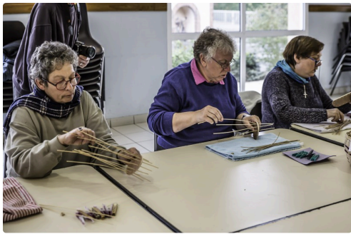
Tout le monde s'y met