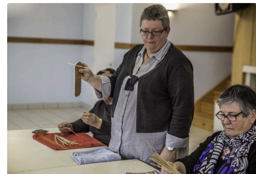
Démarrage avec les brins verticaux