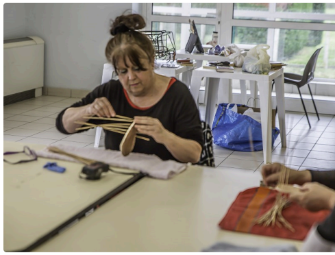
On passe les brins dans les trous