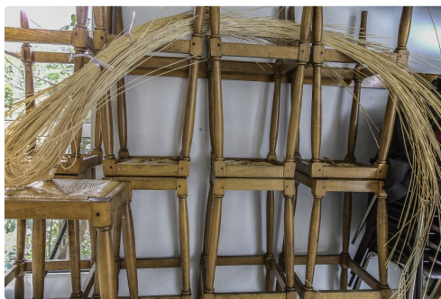
Une gerbe de rotin est en réserve