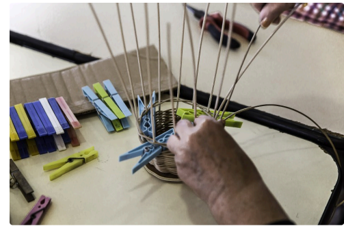
On voit le rôle des pinces à linge