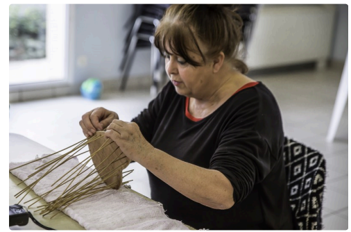
Il faut des doigts agiles