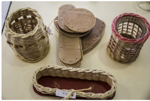
Voilà à quoi ressemblent les objets terminés