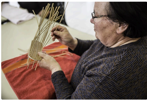
Ce n'est pas facile