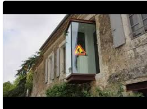
Saint Clar - Médiathèque : Gruissan - Saint-Clar, une histoire de cœur..

Exposition de photos de Gruissan : vernissage jeudi 30 mars à 18h30